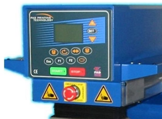
Painel LCD com ajuste electrónico de alturas de impressão e recolha de tinta