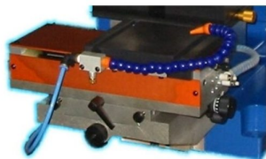
Mesa de impressão ajustável em altura; micro ajuste em eixo XX e YY