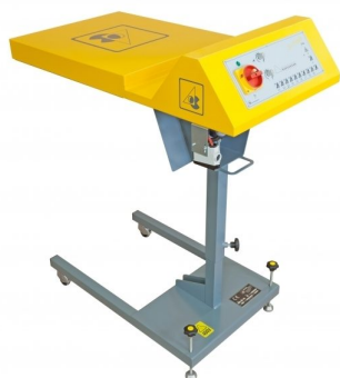
Other shapes of flash cure available