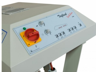
Individual ON/OFF switch with facility to adjust power from output lamp