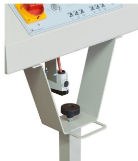
Option to have photocell for automatic start or machine communication