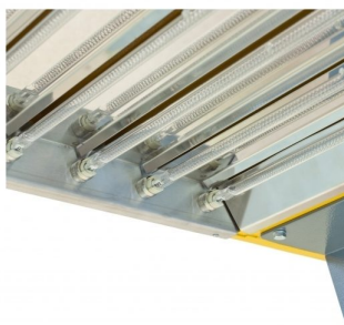
Special lamps holders for easy removal of lamp