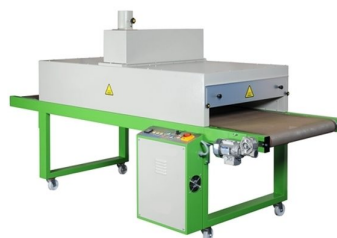
Tuneis para termofixação da impressão disponíveis