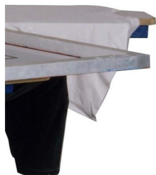
Paletes e quadros podem ser rodados separadamente