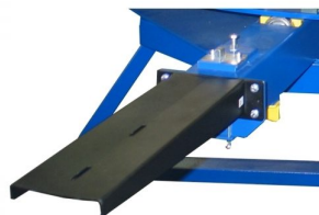
Possibilidade de instalar braços normais de impressão