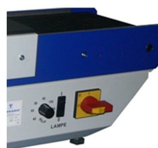
Possibilidade de regular intensidade da lâmpada