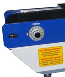
Possibilidade de regular intensidade da lâmpada