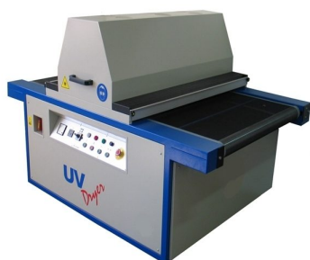
Tunel UV equipados com lâmpadas maiores disponíveis