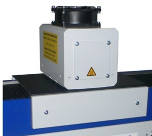
Lâmpada UV sem libertação de Ozono para a atmosfera