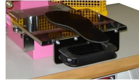
Impressão feita através de cilindro pneumático com ajuste de altura