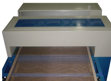
Pontes de ar frio à saída para arrefecimento de peça disponíveis