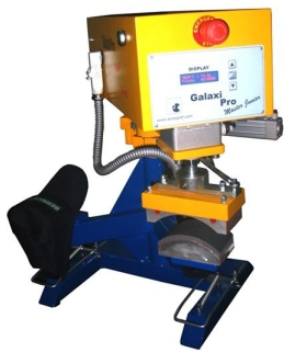
Modelos completamente automáticos de duas cabeças disponíveis