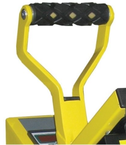
Desenho robusto para ser capaz de suportar forças de transfer altas