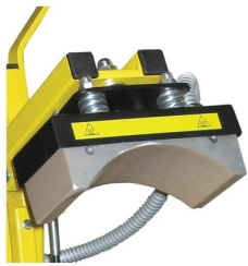
Cabeçal de prensagem com molas de compensação de pressão