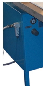
Móvel de apoio e suporte incluído