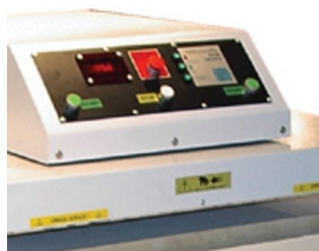
Controlador de temperatura com programa de economização de energia