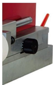
Micro registros de impressão com ajuste na base de máquina