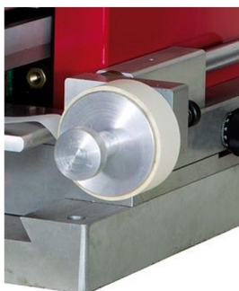
Limpeza de tampão automática com encoder e controlada automaticamente de série