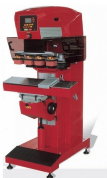
Modelos para impressão de diversas cores disponíveis