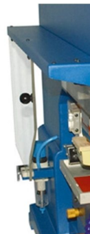
Portas laterais com micro suite de paragem de emergência