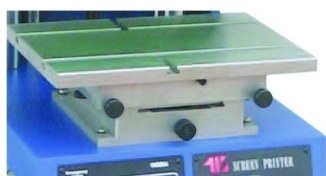
Micro registos de impressão com ajuste na mesa de colocação de peça