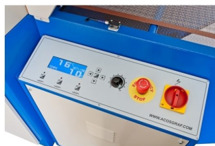
Opção de painel electrónico com opção de economização de energia