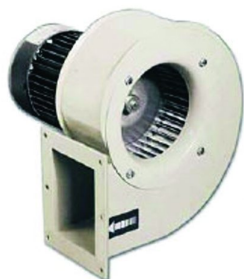
Turbina de re circulação de ar quente de alto rendimento dando a possibilidade de secar tintas base de água e outras