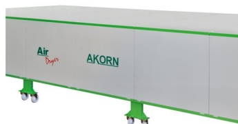
Construção modular com alto isolamento termico para satisfazer todas as necessidades