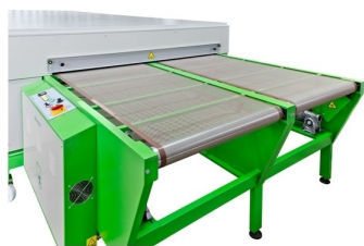
Possibilidade de colocação de duplo tapete com velocidades independentes como opção