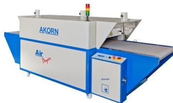
Modelos de estufas mais pequenas capazes de secar DTG disponíveis