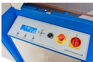
Possibilidade de instalação de painel electrónico com modo de economia de energia