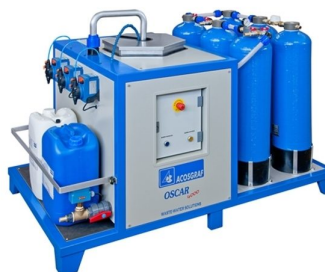
Máquina de tratamento de águas residuais de serigrafia disponíveis