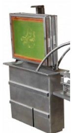
?Tanque de imersão de quadro (DIP TANK) com capacidade para 2 quadros em simultâneo