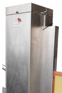
?Possibilidade de utilização da máquina em sistema de revelação ou decapagem de quadros separadamente