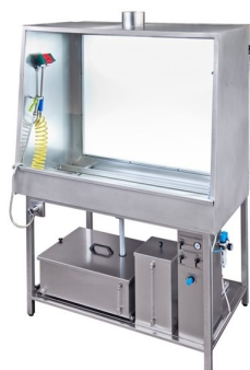
Tanques de lavagem manuais com 2 sistemas de efluentes disponíveis