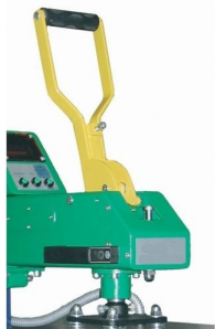
Descida do prato de calor vertical com manipulador de alta robustez