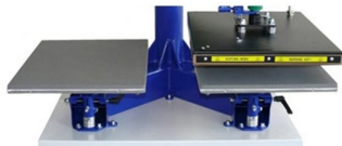
Duplo prato de colocação de carregamento de peça para colocação do transfer