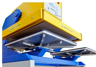
Possibilidade de troca de base inferior