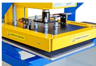
Barra de segurança no movimento lateral e prensagem