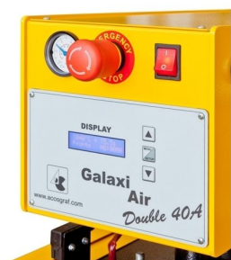
DISPLAY LCD with several languages available