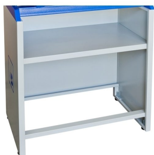
Movel de colocação de máquina com prateleira como opção