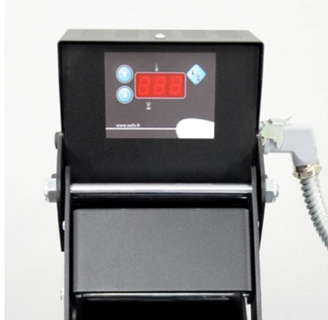
Temperature and timer digital controlled