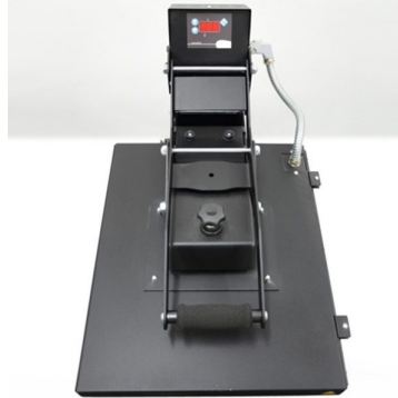
Pressure point adjustment by central point