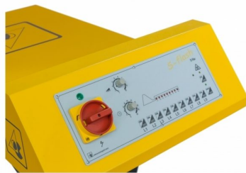
Individual ON/OFF switch with