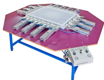
Modelos com pinças pneumáticas disponíveis