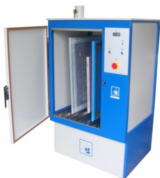
Horizontal or vertical drying cabinet