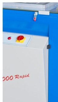
Instant ON/OFF from halogen lamp