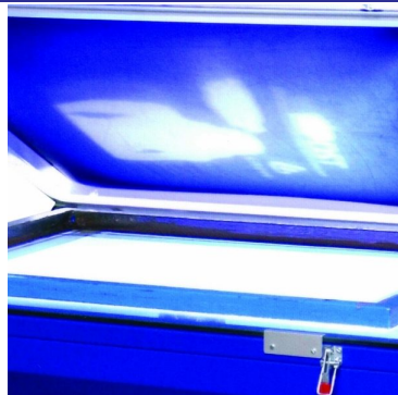
Halogen light source