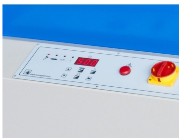
Digital programmer from exposing times with photo cell