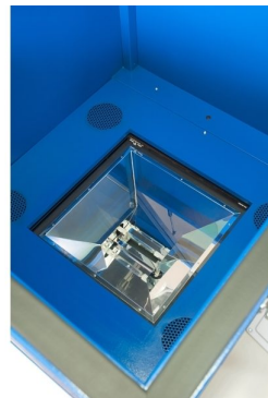
Units equipped with metal haladide lamps available