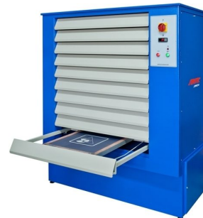
Drying cabinets with several sizes available