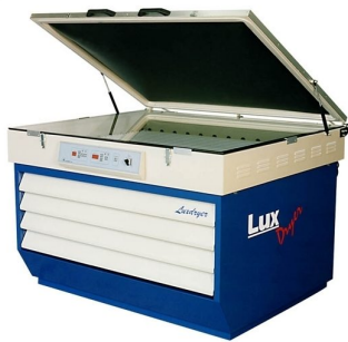
Exposure units equipped with drying cabinets available