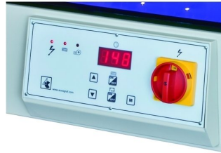
LCD display with electronic timer full automatic