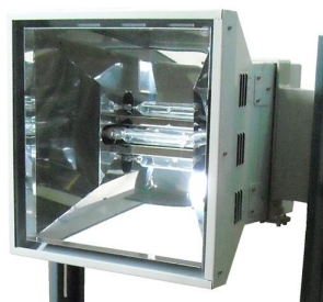
Fonte de luz metal/halógena