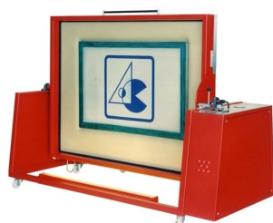
Modelo VERTSCREEN (modelo com cambalhota de quadro) disponível