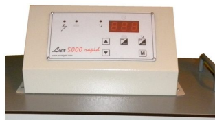
Programador digital com controlo de tempos de exposição