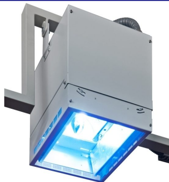
Equipée avec lampe halogène de haute puissance