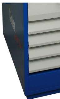
Séchage écrans avec ventilation forcée et avec contrôleur numérique digital