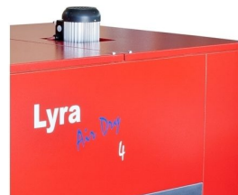
Turbina de recirculação de ar quente de alto rendimento