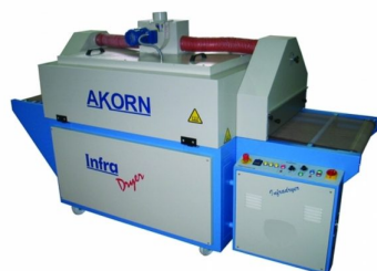
Sistemas de secagem textil em tapete disponiveis