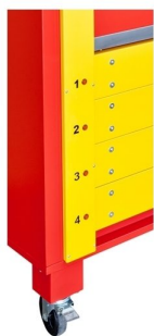
Leds individuais de finalização de tempo de secagem