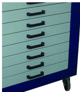
Numero de gatevas configuraveis de 2 a 8