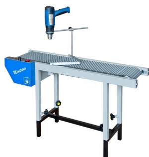
Outros modelos de transportadores com malha de aço e mais economicos disponiveis