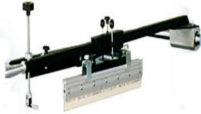
One guide hand arm with pressure control from squeegee and flood bar