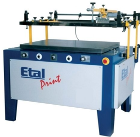
Other models with parallel opening and table top available