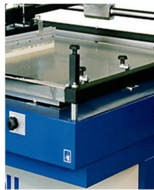
Possibility to print in flat material with height up to 100 mm