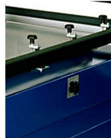
XX and YY micro adjustments from printing