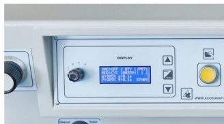
Display com LCD com diversas informações de velocidades, tempos, modos de trabalho, etc..