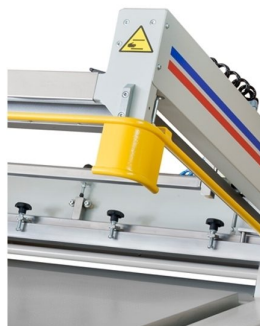
Barra de emergência com inversão automática do sentido em toda a área da máquina para protecção total do operador