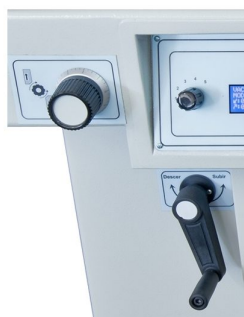
Ajuste do tampo em altura a permitir impressão em objectos até 20mm de espessura