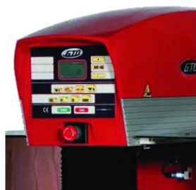
Painel LCD de 5 linhas com ajuste de alturas de impressão e recolha de tinta feita electronicamente por encoder