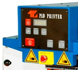
Painel com display contador de peças e paragem de emergência