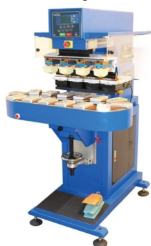
Máquinas com mais cores e com formatos de impressão maiores disponíveis