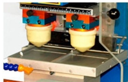
Sistema de impressão feito através de tinteiro aberto com possibilidade de impressão a 2 cores