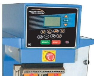
Painel de comandos com LCD