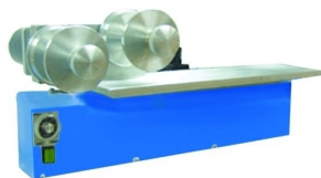
impeza automática de tampão disponível