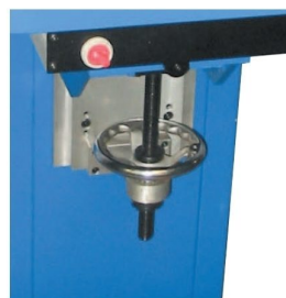
Mesa de impressão ajustável em altura