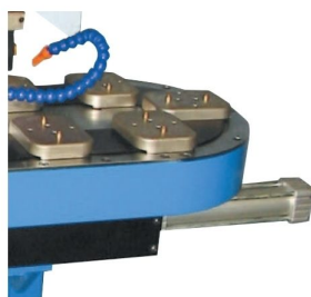
Sistema de transporte de peça tipo carrssel com 10 posições