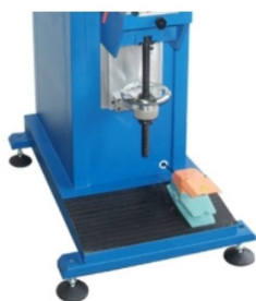
Mesa de impressão ajustável em altura com volante Sistema de tinteiro aberto com medida máxima de 200x150 mm