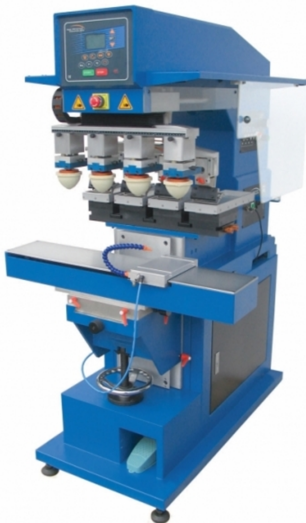
TAMPO - AC - 4 - 140 mm

Note: As características podem ser alteradas sem aviso prévio