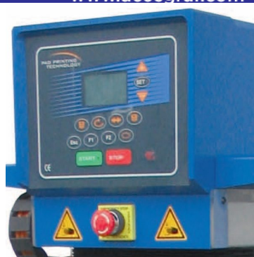
Painel de comando com LCD