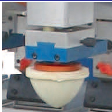
Descida individual de tampão como opção