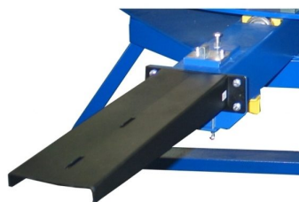
Braço de suporte de paletes super estável com ajustes de profundidade