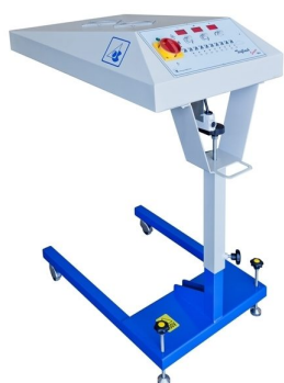
Secadores intercalares de impressão disponíveis