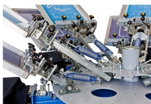
Duplo deck de tubo de cores para máximo número de cores com o menor diâmetro