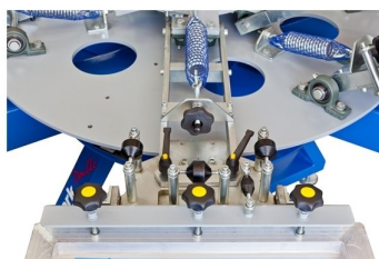
Micro registros de impressão nos diversos eixos