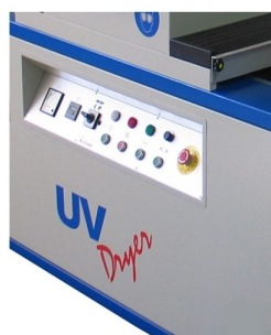
Option de ajustement de la puissance de travaille de la lampe UV pour arrivai dans une séchage parfait