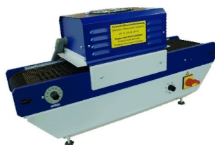
Systèmes UV pour travaille sur laboratoire ou même pour