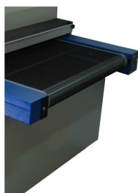
Tapis en Teflon anti-statique