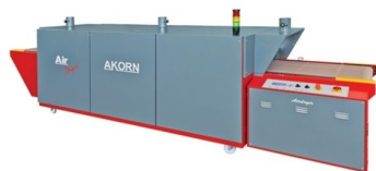
Full range from dryers available to cure and dry plastisol and water base transfers