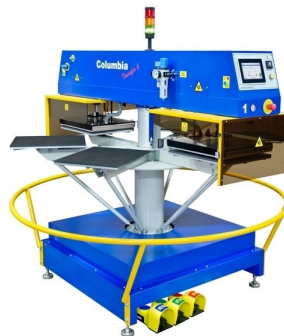
Full automatic carousel heattransfer machine available