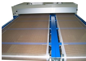
Possibilidade de equipar tunel com 2 tapetes individuais