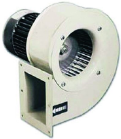
Turbina de re circulação de ar quente de alto rendimento dando a possibilidade de secar tintas base de água e outras