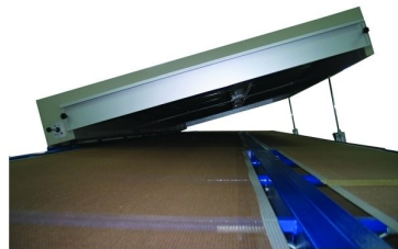
Opção de abertura lateral feita através de cilindros disponíveis