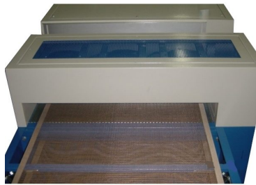
Pontes de ar frio para arrefecer peça disponíveis