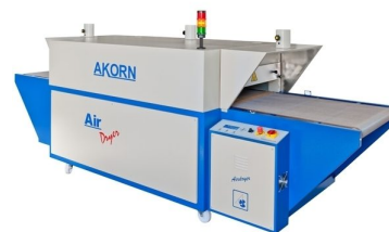
Tuneis para secagem de impressão feita através de DTG disponíveis