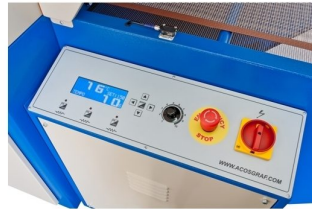
Opção de painel electrónico com opção de economia de energia