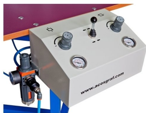
Disponível 2 circuitos independentes XX e YY com ajuste individual