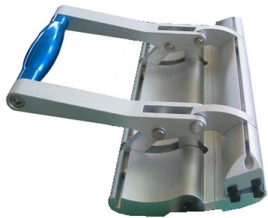
Pinça ergonómica de elevada robustez capaz de resistir até 60N de tracção