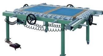
Esticador de quadros híbrido disponíveis