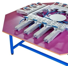
Tensiómetros de medição de tensão na tela disponíveis