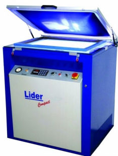
Diversos modelos de exposição de quadros disponíveis