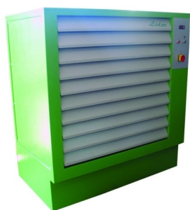
Estufas de quadros horizontais disponíveis