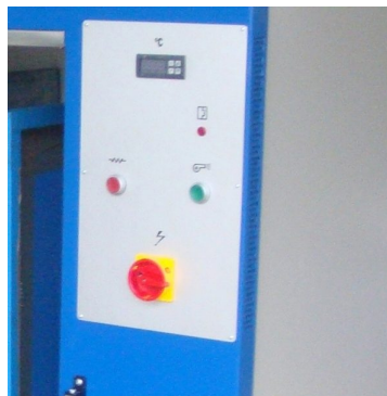
Controlador de temperatura com display digital