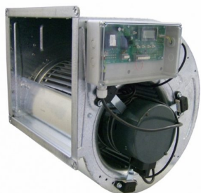
Ventilador de ar quente de alto rendimento