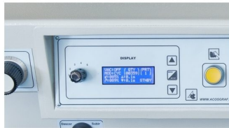
Display com LCD com diversas informações de velocidades, tempos, modos de trabalho, etc..