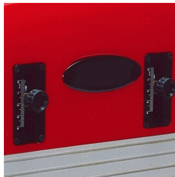
Ajuste individuais de alturas de impressão/ recuperação de tinta