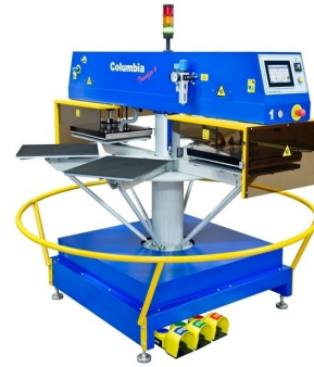
Full automatic carousel heattransfer machine available