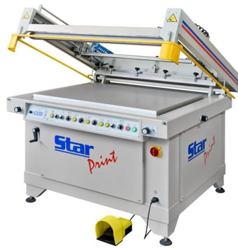
1/2 and 3/4 automatic screenprinting machines available