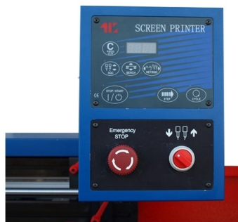
Painel digital com LCD e com diversos programas de impressão