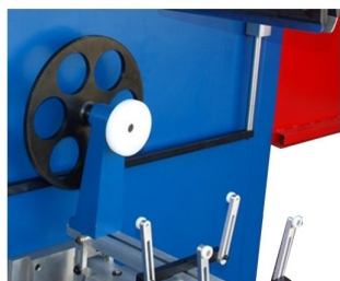
Acessório c/ cremalheira para aplicar roda dentada para grandes formatos como opção