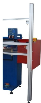
Proteções de operador com botão de paragem de emergência incluídas