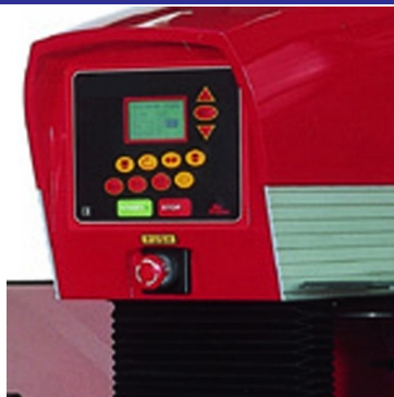
Painel de comando com LCD