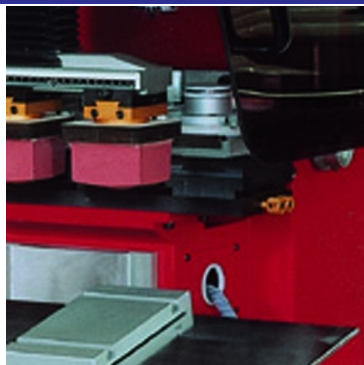
Sistema de impressão por tinteiro fechado