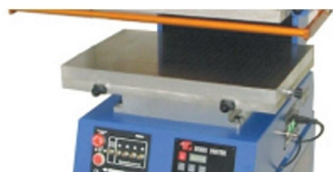
Micro registos de impressão com ajuste na mesa de colocação de peça