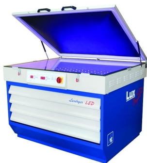
Diversos modelos de prensa de abrir quadros disponíveis