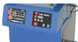
Micro registos de impressão com ajuste na mesa de colocação de peça