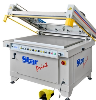
Máquinas semi automáticas de maiores formatos de impressão disponíveis