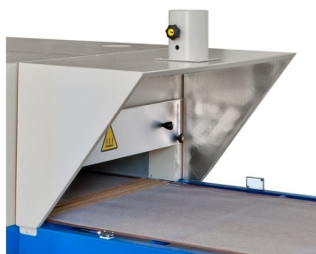
Cone de aspiração de fumos na entrada e saída com motor e regulação de sucção