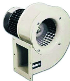
Turbina de recirculação de ar quente de alto rendimento dando a possibilidade de secar tintas base de água e outras