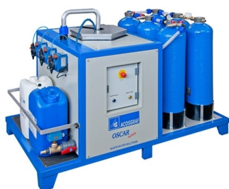
Sistemas de tratamento de águas residuais disponíveis