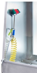
Sistema de cores para uma melhor identificação do operador entre solventes limpos/sujos