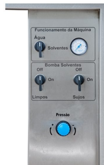
Painel de controlo com: válvula para mudança de efluentes; botão individual das 2 bombas pneumáticas e manómetro de pressão