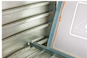
Rail de quadro serigráficos com possibilidade de ajuste em profundidade e altura