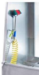
Sistema de cores para uma melhor identificação do operador entre solventes limpos/sujos