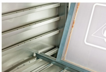
Rail de quadro serigráficos com possibilidade de ajuste em profundidade e altura