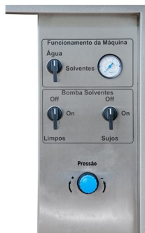
Painel de controlo com: válvula para mudança de efluentes; botão individual das 2 bombas pneumáticas e manómetro de pressão