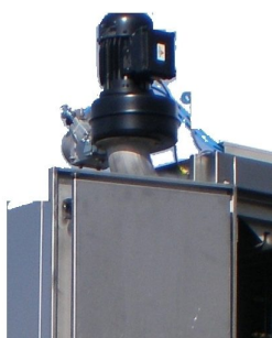
Equipado com ventilador de extracção de vapores de solvente