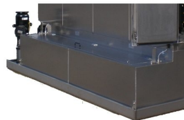
Deposito de solvente para funcionar em circuito fechado