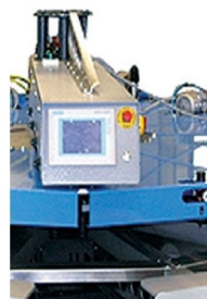
Touch Screen com linguagem em Português