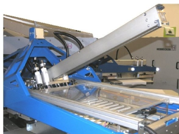
Opção de levantamento das cabeças de impressão para fácil retiro da racklete e contra racklete