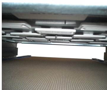
Distribuição perfeita das resistências sobre a largura do tapete